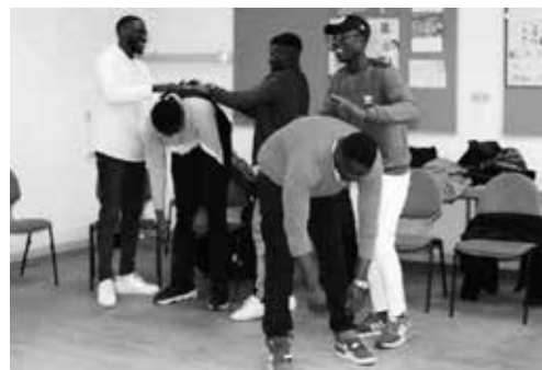
Theaterworkshop Mut zum Selbstsein