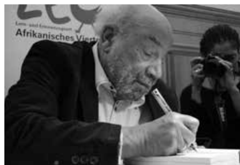
Theodor Wonja Michael († 19. Oktober 2019), Überlebender der NS-Zeit, bei der Vorstellung seines Buches „Deutsch sein und schwarz dazu: Erinnerungen eines Afro-Deutschen“