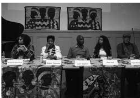
Afro-Türken bei einer Veranstaltung der Schwarzen Volkshochschule