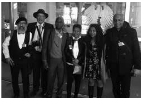
Afro-Türken aus Izmir zu Besuch in Berlin bei einer Veranstaltung mit Dr. Karamba Diaby, MdB

Die Afrika Akademie / Schwarze Volkshochschule besteht aus fünf Teilbereichen.