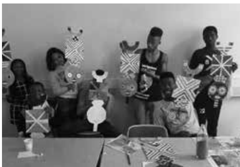
Kinder stellen bei der Afrodiasporischen Samstagsschule selbst Masken her

Gemeinsam werden Strategien entwickelt, um sich trotz alltäglicher, struktureller sowie institutioneller Rassismuswahrnehmungen und -erfahrungen, selbstsicher und bewusst in der Öffentlichkeit bewegen zu können.