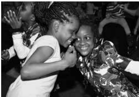
„African Kids Get Together“ beim Black History Month

Die Zielgruppe der Afro-Samstagsschule sind Berliner Kinder im Kindergarten- und Grundschulalter mit familiären Wurzeln in Ländern Afrikas. Die Kinder werden samstags in den Fächern Geschichte, Sprachen, Kultur, Rassismus, Performing Arts und Sport gemeinsam unterrichtet.