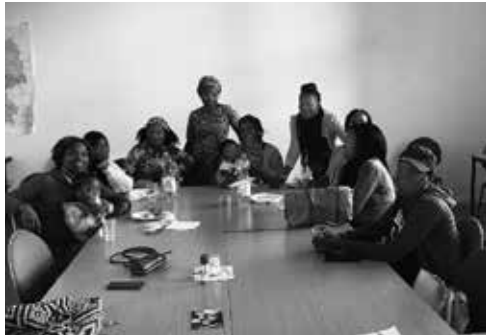
Empowerment Workshop für afrikanische Frauen

Der dritte Teilbereich widmet sich dem Empowerment afrikanischer Frauen, die durch die Angebote und Veranstaltungen der Schwarzen Volkshochschule dabei unterstützt werden, ihre soziale, berufliche und gesellschaftliche Position zu verbessern.