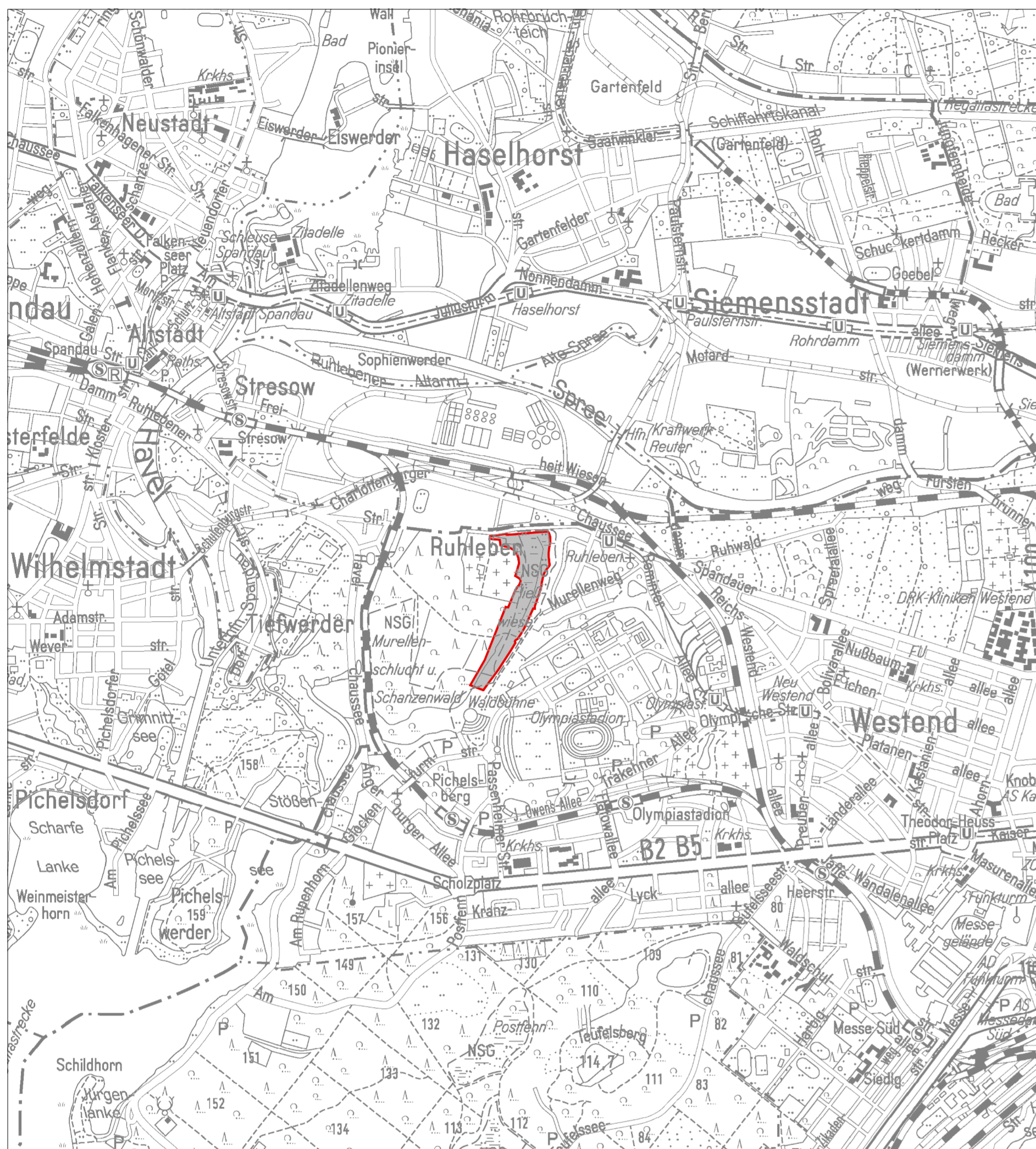
Ausschnitt aus der Übersichtskarte 1:50 000 (vergrößert) Ausschnitt aus der Luftbildkarte